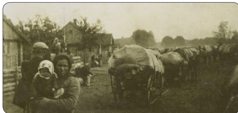
Ucieczka z Drozdowa w 1915 roku