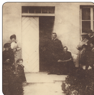
Lutosławscy przed wyjazdem do Moskwy