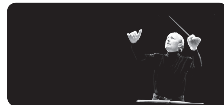
Witold Lutosławski w roli dyrygenta występował z najlepszymi orkiestrami i solistami świata, wykonując wyłącznie własne kompozycje

Muzeum Przyrody w Drozdowie systematycznie organizuje koncerty z muzyką Witolda Lutosławskiego. W latach 2002–2010 Towarzystwo Przyjaciół Muzeum Przyrody w Drozdowie zorganizowało pięć edycji Konkursu Wykonawczego Utworów Witolda Lutosławskiego dla uczniów szkół muzycznych z całego kraju. W ostatnich latach organizacją tegoż konkursu zajęła się Fundacja Polskiej Rady Muzycznej w Warszawie. W realizację tych przedsięwzięć byli zaangażowani wybitni polscy muzycy. Do Drozdowa przyjeżdżali także twórcy filmów biograficznych o kompozytorze oraz autorzy książek i innych publikacji na jego temat.